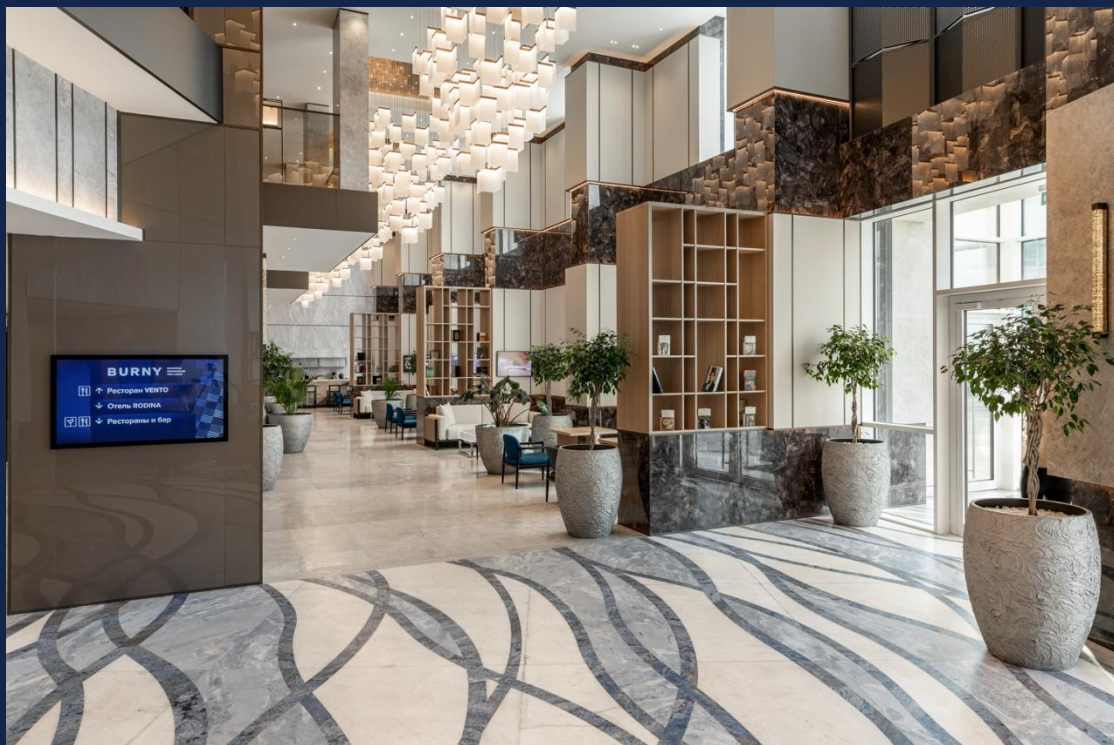
Лобби – 1 этаж