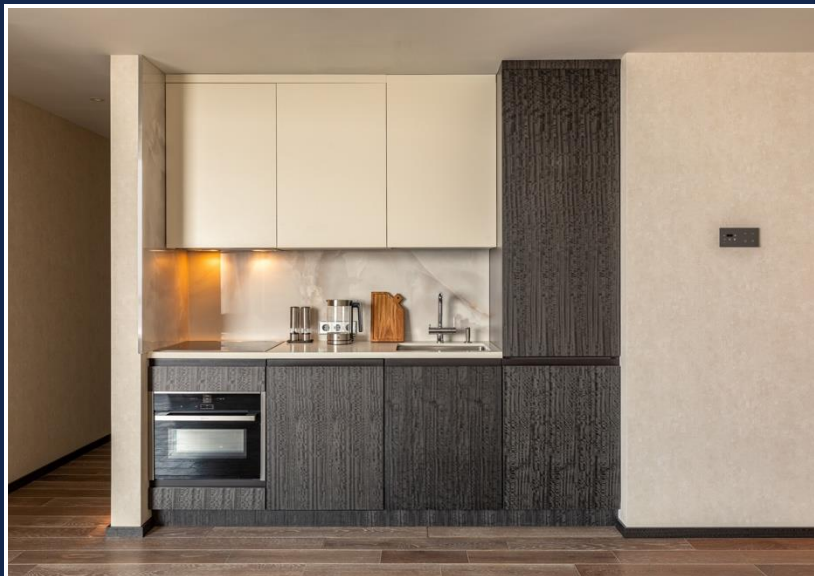
Собственная кухня в номере