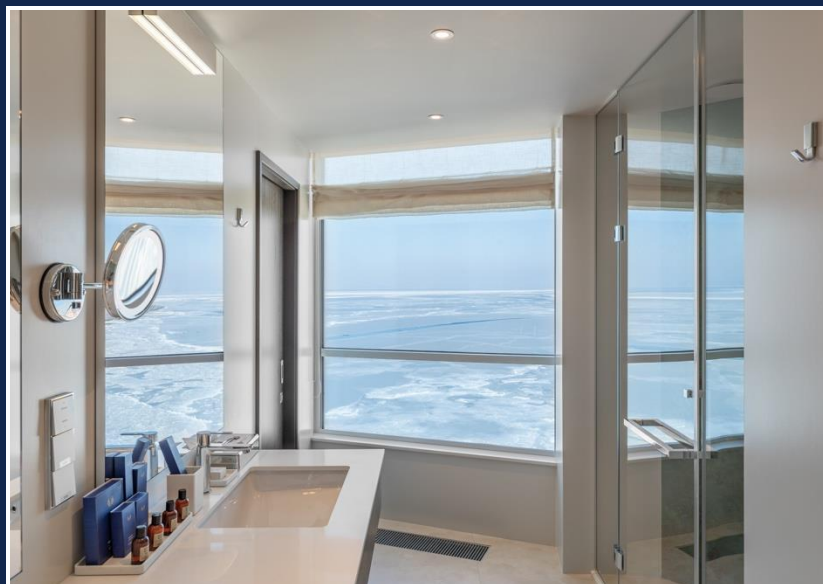
Вид из номера

Комфортабельные апартаменты различных категорий – площадью от 31 до 171 м 2 – располагают собственными кухнями, полностью оборудованными техникой мирового класса.