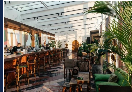
БАР SHE KONG